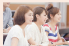
全日制説明会 参加