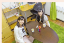
体験入館をする (宿泊)