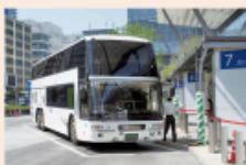
最寄りの駅より バスに乗る