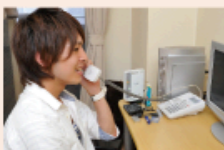
ウッドと 共立メンテナンスに予約