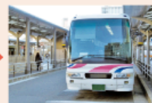
翌日 帰りのバスに乗る